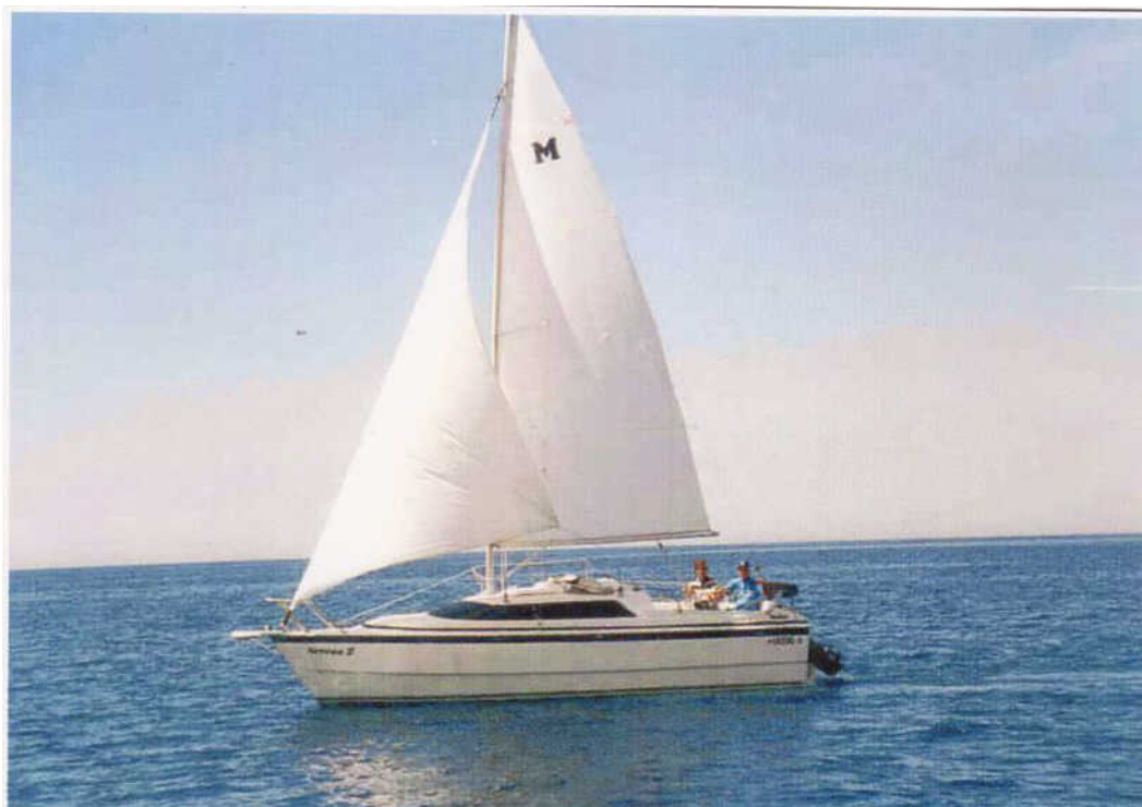
Segelboot MacGregor 26X