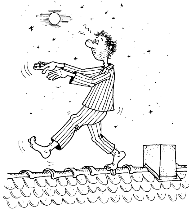
Abb. aus: K. Stegerer: Segeln ernst genommen. München 1988

Aber auch wenn wir nicht gleich um die Welt segeln wollen, ist es bestimmt sehr reizvoll, sich mit dieser „Geheimwissenschaft“ vertraut zu