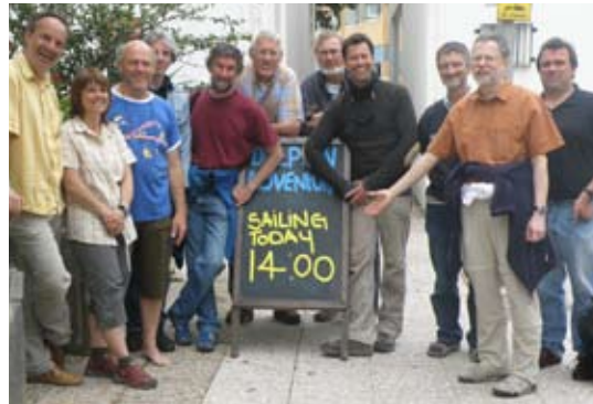
Die Crews der 2. und der 3. Etappe in Gibraltar

ander einen weiteren Törn starten. Das Schiff dafür muss nicht unbedingt von Trend-Travel-Yachting sein!