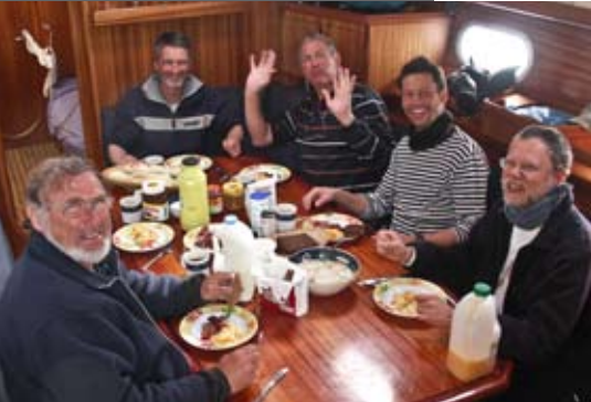
Kreatives Köcheln sorgt für Seemanns Lächeln

te. Und gutes Essen hebt immer die Stimmung.