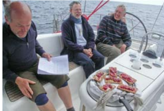
Feierstunde zur Überschreitung des Nullmeridian

Großbritannien hat die Schlacht um den Bezugsort für das Koordinatensystem in der Seefahrt auf den Weltmeeren gewonnen. Deshalb unterbreiten wir den hier gefassten Kodex: Jeder britische Seefahrer und jeder ordentliche Seemann der Weltmeere, dazu gehört auch das Mittelmeer, soll den Nullmeridian mit höchster Ehrfurcht überfahren. Dazu ist die Geschwindigkeit auf ein erforderliches Minimum zu drosseln. Der Nullmeridian soll rechtwinklig, also