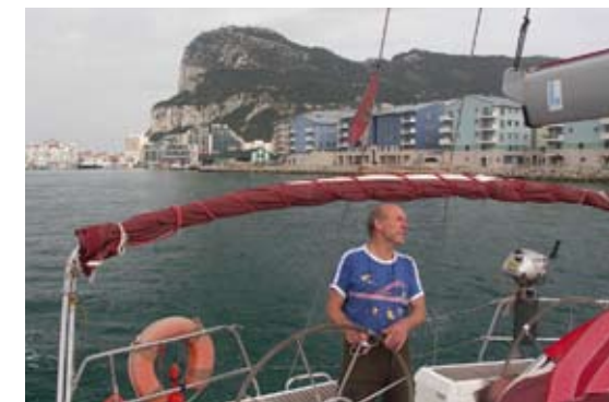
Start der 3. Etappe in Gibraltar

Nach all diesen Anlaufschwierigkeiten, es war schon gegen Abend, konnten sie mit Bellissima endgültig starten. Sie trieben, das Abendessen schlemmend, durch den Hafen, um sich am markan-