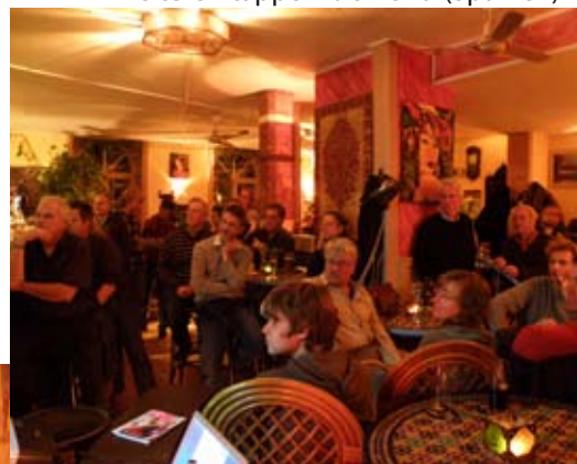
Full House beim Skippertreffen

Am 16. Juli packten rund 30 HSCF-ler ihre Zelte, Campingbusse und Boote, um abermals an den Bodensee zu fahren. Schon im letzten Jahr hatten wir viel Spaß auf dem Campingplatz Fließhorn nahe der Mainau. Freitagnachmittag trafen wir uns auf „unserer“ Wiese, einige waren bereits vorgefahren und hatten schon drei Tage Segelspaß mit Johannes Racer-Katamaran FX1 hinter sich. Zelte aufbauen, Camper und Mobi-