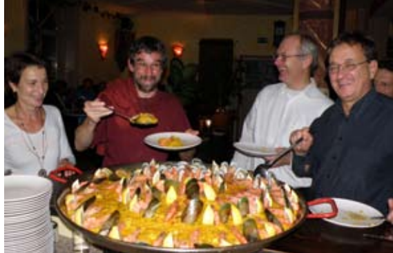
Löffel brassen zum Paella-Fassen!

Gefühlsmäßig würde ich fast sagen, das ist Vereinsrekord – aber das muss noch