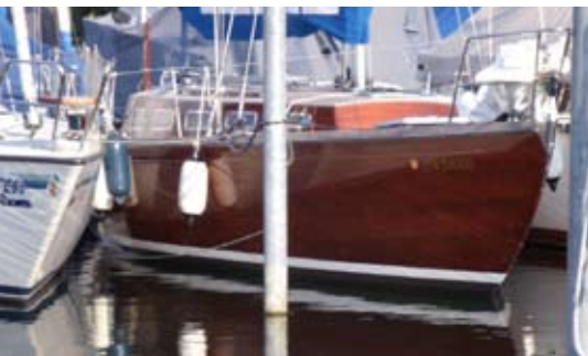
Die Wanderer II am Liegeplatz

Die Höllentalstrecke war gesperrt, so wurde die Route über die Schweiz ge-