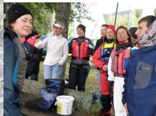
Manöverbesprechung an trockenem Land

Und: Wir sichern Ihre Zahlungen ab. Mit dem Sicherungsschein von YACHT-POOL. Da können Sie sicher sein.