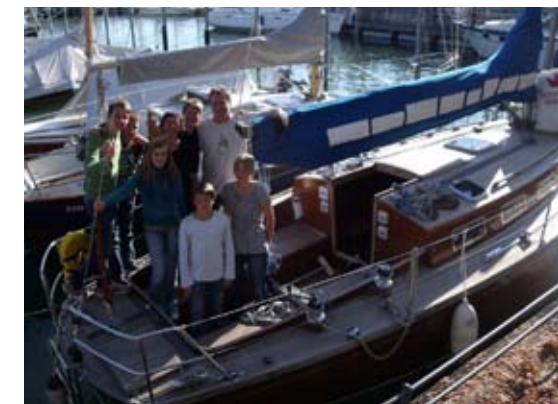
Das war Spitze: Jugend-Bodensee-Tour 2010

Dieses Wochenende hat allen Beteiligten viel Spaß gemacht, eine Wiederholung in der nächsten Saison sollte auf jeden Fall geplant werden.