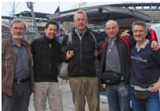
Start in Freiburg

„Absolvieren wir eben ein paar Tage Andalusienurlaub und werden beim Segeln einen Zahn zulegen“ – so dachten sie – und machten sich, wie geplant, am