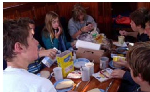
Hungrige Seeleute beim Frühstück

gen Abend einen Übernachtungshafen auf deutscher Seite zu suchen. Auf den Yachthafen Schloß Kirchberg, auf halber Strecke zwischen Immenstaad und Hagnau, traf unsere Wahl. Doch, oh Schreck, alle Gästeplätze waren bereits besetzt. Nach Absprache legten wir uns an einen freien Stegplatz, der allerdings