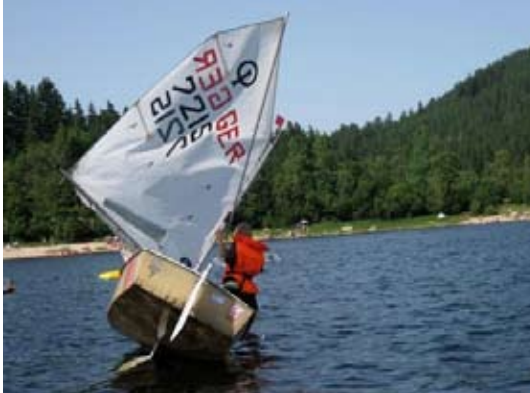
Kentertraining – nur was für echte Optimisten!