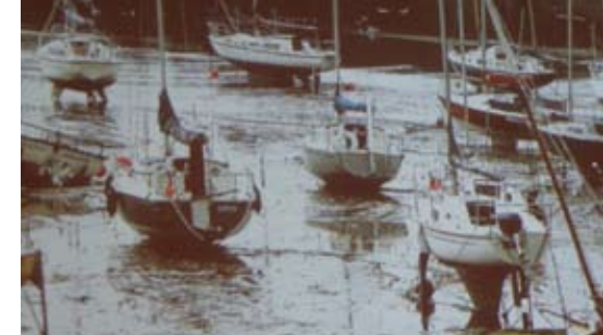
Stehplätze statt Liegeplätze: Gezeitenrevier zeitengewässern unterwegs ist.