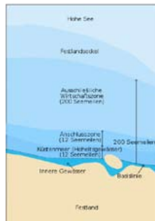
Die Hohe See beginnt erst „weit draußen“...

Nun ist der einzige gesetzlich vorgeschriebene, amtliche Schein in Deutschland für Seegebiete der SBF-See: