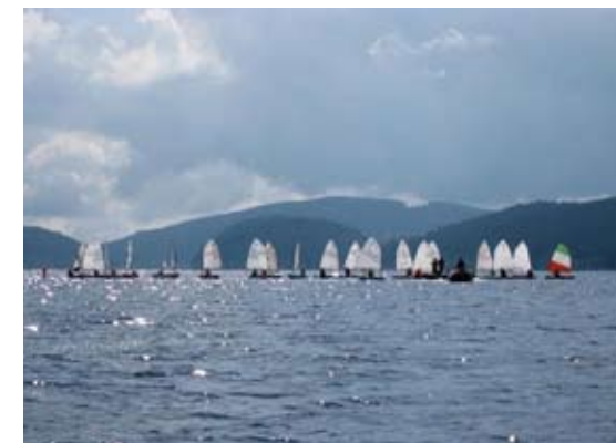
Optimistenflotte auf dem Schluchsee

Die Jugendabteilung des Hochschul-Segelclubs kooperiert seit Jahren eng mit der Segeljugend Schluchsee (SJS), um den Kindern und Jugendlichen aus dem