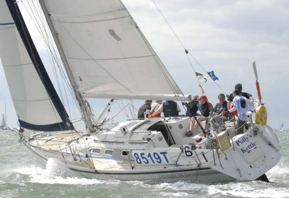
Polly's Kettle mit dem Verfasser (3. v.r.)