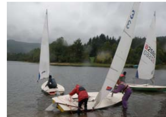
Dem Regen zum Trotz – es geht auf's Wasser!

tagnachmittag und als ich Freiburg erreichte, ging die Sonne unter und mit beginnendem Regen und Dunkelheit schlängelte ich mich durch den Schwarzwald. Kein Wunder, dass dieser