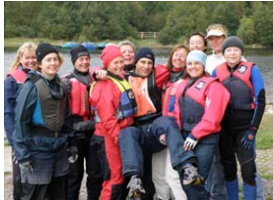
Constantin lebe hoch: Abschluss bei Sonnenschein

Manövertchnik, Wenden und Halsen bestimmten den ersten Teil des Trai-