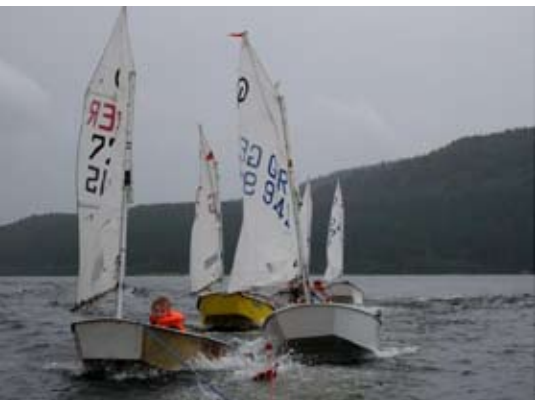
Alle meine Optis – schwimmen auf dem See ...

Die Segeljugend Schluchsee stellt in jeder Saison einige Teilnehmerplätze für die Kinder und Jugendlichen des HSCF zur Verfügung. Diese Kursplätze sind immer sehr gefragt, so dass oft mehr Anmeldungen als freie Plätze vorhanden sind. Der Andrang ist insbesondere bei den Opti-Anfängerkursen sehr groß, gleichzeitig ist die Anzahl der Plätze beschränkt, da der Betreuungsaufwand bei den Anfängern enorm ist. Beim Anfängerkurs werden für 13 teilnehmende Kinder drei Segeltrainer (und zwei Motorboote) benötigt, bei den Fortgeschrittenen-Kursen können i.d.R. alle HSCF-Kinder berücksichtigt werden.