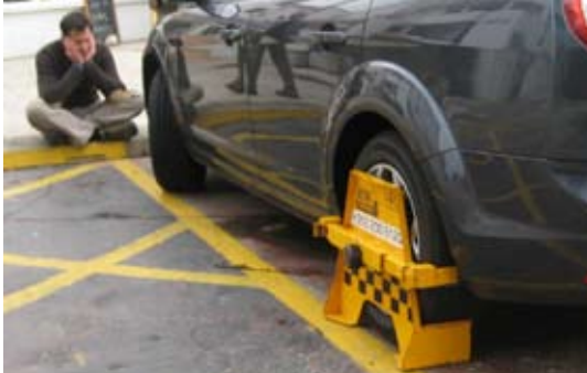
Die Briten zeigten uns die Kralle

Mittlerweile war es Montag, der 12. April, als Andalusien abgegrast, die Crew unruhig und wieder vollständig war. Der Start rückte näher und dank Mietwagen konnten sie die erschöpften Segler entlasten und ihnen Richtung Westen entgegenkommen. Dafür gab es mehrere Optionen: ganz westlich liegt Tarifa oder, wenn die Atlantikfahrer sich zum Abschluss noch die Straße von Gibraltar gönnen wollten, die Städte Algericas, La Linea und Gibraltar. Auf die Frage nach dem Übergabeort kam die Antwort „Gibraltar“. Die wollen doch nicht allen